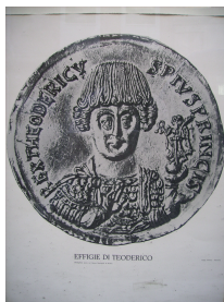
Teoderik (den store)

Järnåldern (500 f kr – 1060 e kr). En klimatförsämring inträdde, med den så kallade fimbullavintern. Tillgången till livsnödvändigheterna utarmades och vi lämnade en tillvaro kännetecknad av mycket frid och fred för ett liv med kamp om födan och uppehållet. Många från främst Västergötland lämnade och flyttade söderut – liksom än idag då kylan gör sig för outhärdlig – ner genom främst Europa. Och som goter har det sagts att man lade grunden till många nationers födelse. Jordanes, 500-talet e Kr, som var skriftställare åt den gotiske kungen Teoderik skrev ner goternas historia. Teoderik var känd bl a för att ha varit med och gjort slut på det stora Västromarriket och regerat under en tid som i sin eftertid kommit att heta ”Felix Roma” = det lyckliga Rom. Han är förmodligen även omskriven på Rökstenen i Östergötland. Jordanes skrev också att goternas härkomst/urhem skulle vara vid Göta Älvs mynning dvs bl a före detta Kaverös/Högsbobor. Än idag kan man på Barcelonas historiska museum se på karta över folkvandringarna hur de stolta urkatalanernas, de med blått blod i ådrorna -, väg gick ner gick härifrån ner till Gotalonien / Katalonien.