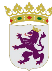
Folkungalejon(?) från León.

Asturien och Aragonien var ett av de sista områdena i Europa där gotisk kungslängd och gotisk lag var gällande.